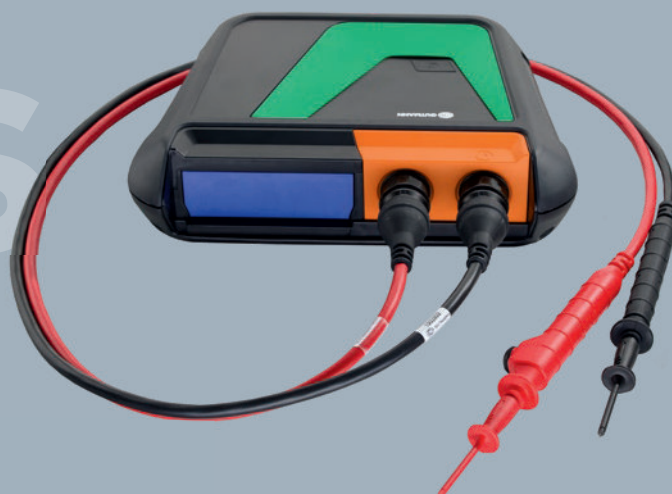
bestehend aus MT-HV + Hochvolt-Messleitungen schwarz/rot