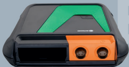
bestehend aus MT-HV