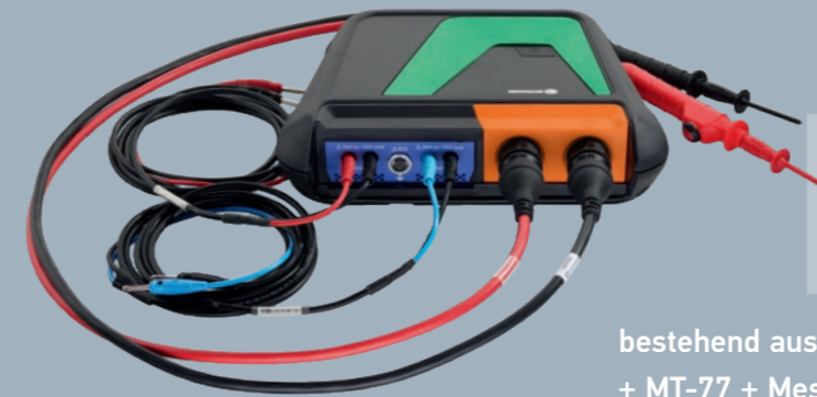
bestehend aus MT-HV + Hochvolt-Messleitungen schwarz/rot + MT-77 + Messkabel schwarz/blau + Messkabel schwarz/rot