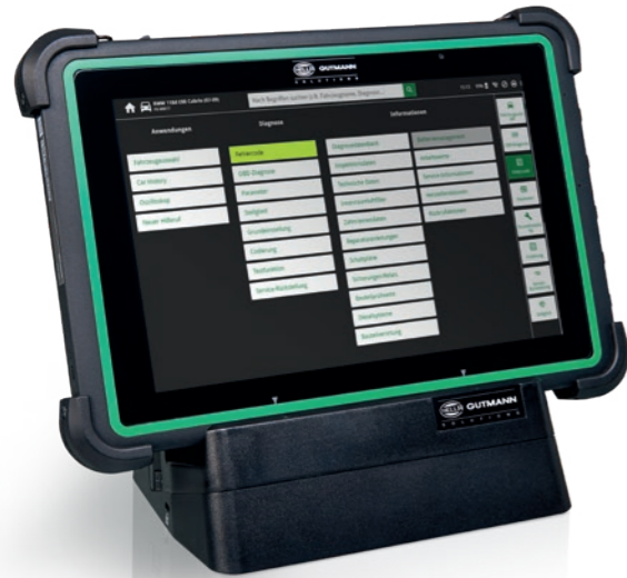
Hella Gutmann Tablet mit Dockingstation

Besonders leicht wird der Start in die Diagnose mit dem optionalen Hella Gutmann Tablet. Das moderne Android-Tablet kommt mit einer Dockingstation, die zahlreiche Schnittstellen bedient (HDMI, Ethernet etc.). Es wurde von uns sorgfältig mit Blick auf Schnelligkeit, Zuverlässigkeit und Robustheit ausgewählt sowie auf die Diagnose mit dem mega macs X abgestimmt.