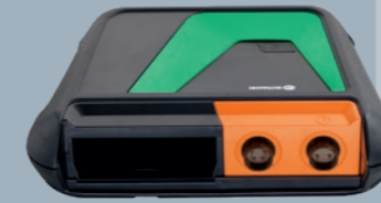
bestehend aus MT-HV