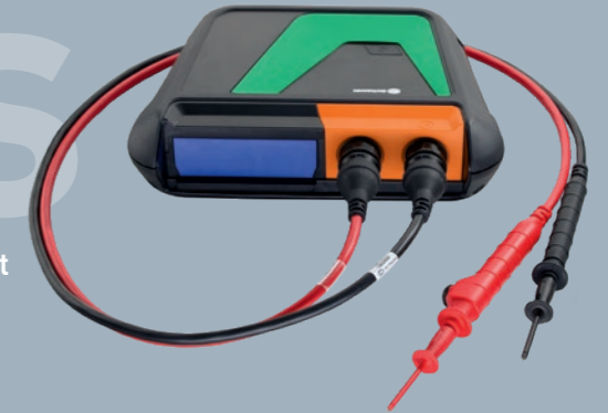
bestehend aus MT-HV + Hochvolt-Messleitungen schwarz/rot